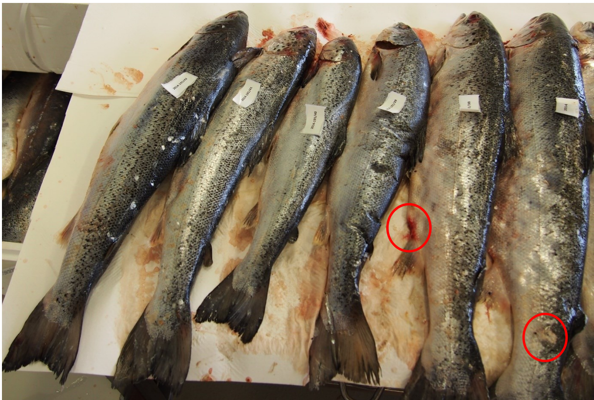
Bilde 1. Laks tatt fra utkastkaret under uttaket i M&R i februar 2014. Sett fra venstre; kun fisk nr 3 har karakteristisk taperfiskstørrelse. Resten ble sortert ut og havnet i utkastkaret på grunn av andre kvalitetslyter som for eksempel blødninger eller sår (se sirkler).