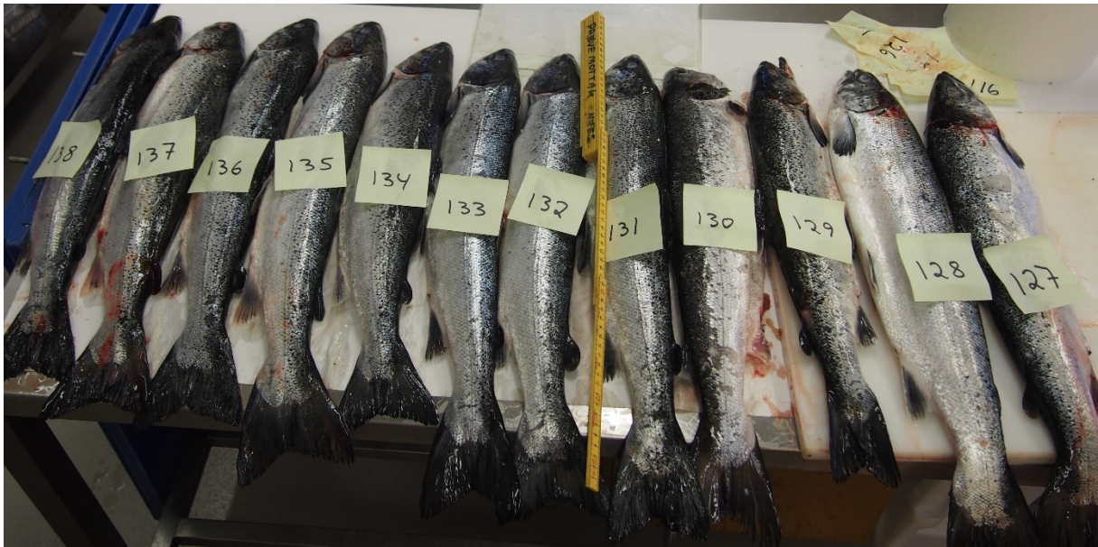
Bilde 2. Laks tatt fra utkastkaret under uttaket i M&R i oktober 2014. Fisk nr 132 (taperfisk) var infisert med 2 kjønnsmodne H. aduncum i tarmen.