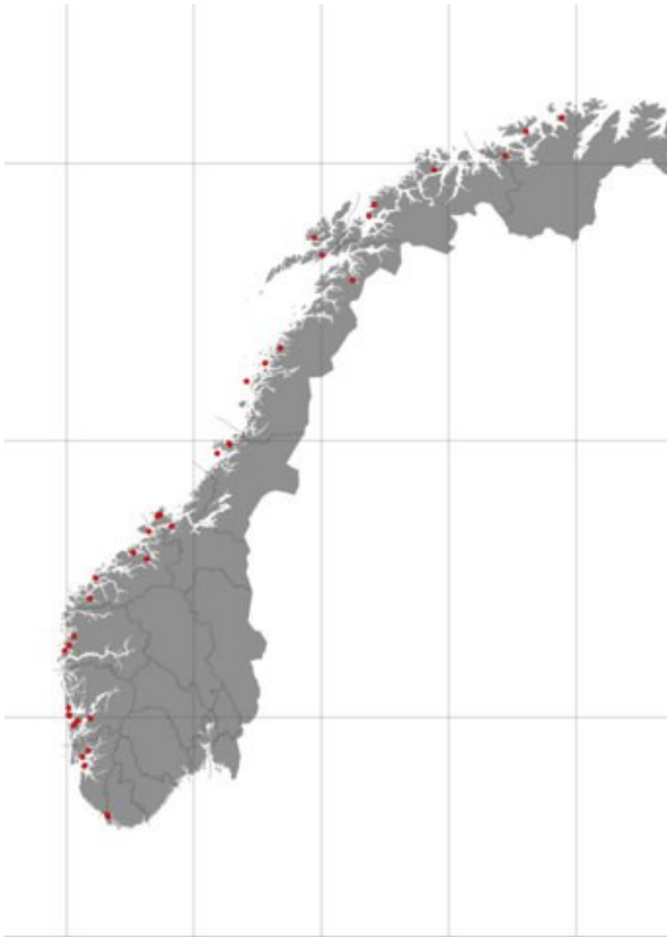
Figur 1. Oppdrettslokalitetene for laksen som inngikk i undersøkelsen for mulig forekomst av kveis.