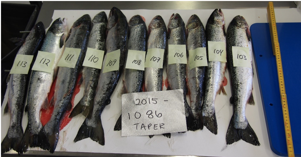
Bilde 4. Taperlaks fra uttaket i M&R i juni 2015. Fisk nr 103 var infisert med 1 kjønnsmoden H. aduncum i tarmen.