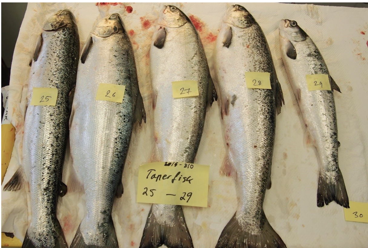
Bilde 3. Laks tatt fra utkastkaret fra anlegget i Vest-Agder i mai 2015. Fisk nr 29 (typisk taperfisk; 825 g, K-faktor 0.88) var infisert med 2 Anisakis simplex rundt innvollene. Fisk nr 26-28 må regnes som tvilstilfeller med vekt på hhv 2318, 1784 og 2051 g, og alle med K-faktor > 1.00.